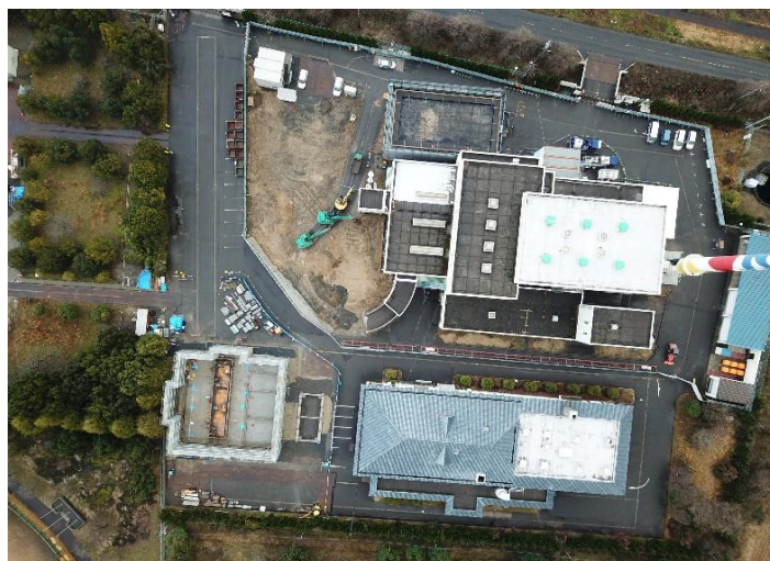
全景（上空からの撮影）