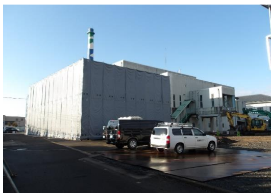
地上からの写真（北面）