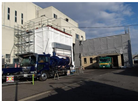
地上からの写真（東面）