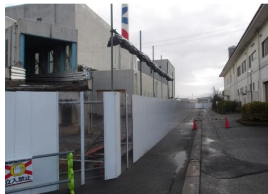
地上からの写真（西面）