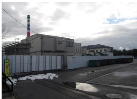
地上からの写真（北面）