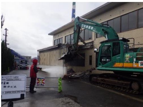
地上からの写真（東面）